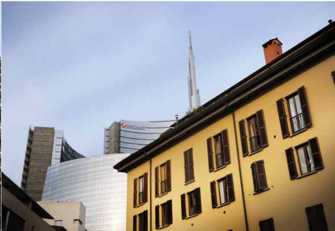
In de wijk Porta Nuova staat het hoogste gebouw van Italië: de Torre Unicredit.

apostelen niet bewonderen, want elk kwartier volgt een andere groep van dertig bezoekers. Een door Unesco als werelderfgoed erkend monument wordt op die manier bijna een kermisattractie... Speciaal voor de Expo 2015 wordt da Vinci's Laatste Avondmaal gereconstrueerd. De deelnemers aan de reconstructie betalen zo'n torenhoog bedrag dat het onderhoud van kerk en kunstwerk voor minstens enkele jaren is verzekerd. Amen!