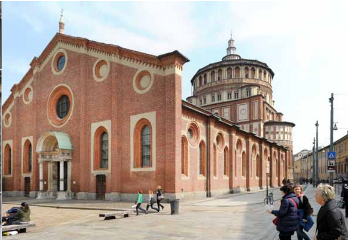
In de Chiesa Santa Maria delle Grazie prijkt het wereldvermaarde Laatste Avondmaal van Leonardo da Vinci.

een plaats in de rekken. In Eataly bevinden zich ook zes restaurants: een pasta- en pizzahoek, een vleesrestaurant, een visrestaurant, een bakkerij, een dessertbuffet en het sterrenrestaurant Alice. Al die restaurants bereiden hun gerechten met producten uit de rekken van Eataly, wat inspireert om al dat lekkers ook zelf eens te bereiden (en daar te kopen natuurlijk).