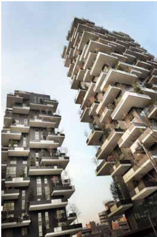
De Bosco Verticale, twee woonblokken met in totaal duizend bomen erop.