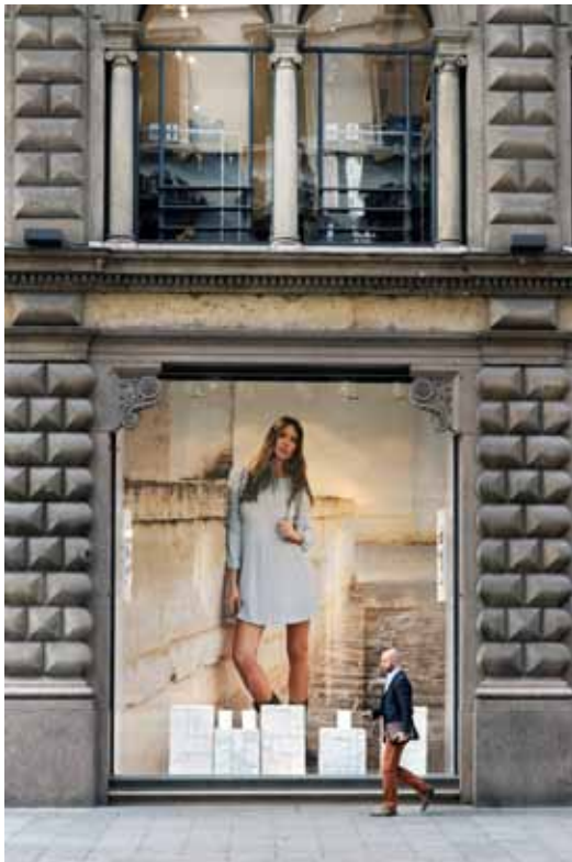
Struinen langs de vitrines tussen de Duomo en het Castello Sforzesco.