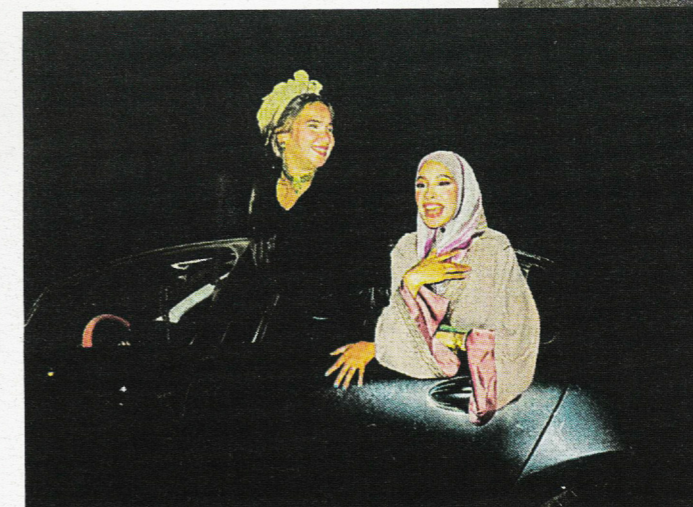
La noche en la Corniche Chicas ataviadas con trajes típicos que celebran una despedida de soltera al son del 'zaghrouta'

Pocas imágenes son tan icónicas como la silueta imponente de la mezquita Hasan II. Basta verla frente al Atlántico para saber que hemos llegado a Casablanca. Su minarete, con más de 200 metros de altura, es visible desde casi cualquier punto de la ciudad. Bajo su sombra, palpita una ciudad tan decadente como fascinante, donde el legado colonial francés, la tradición marroquí, los centros comerciales y los edificios de oficinas se mezclan sin complejos en la que es una de las ciudades con más potencial de todo el continente africano.