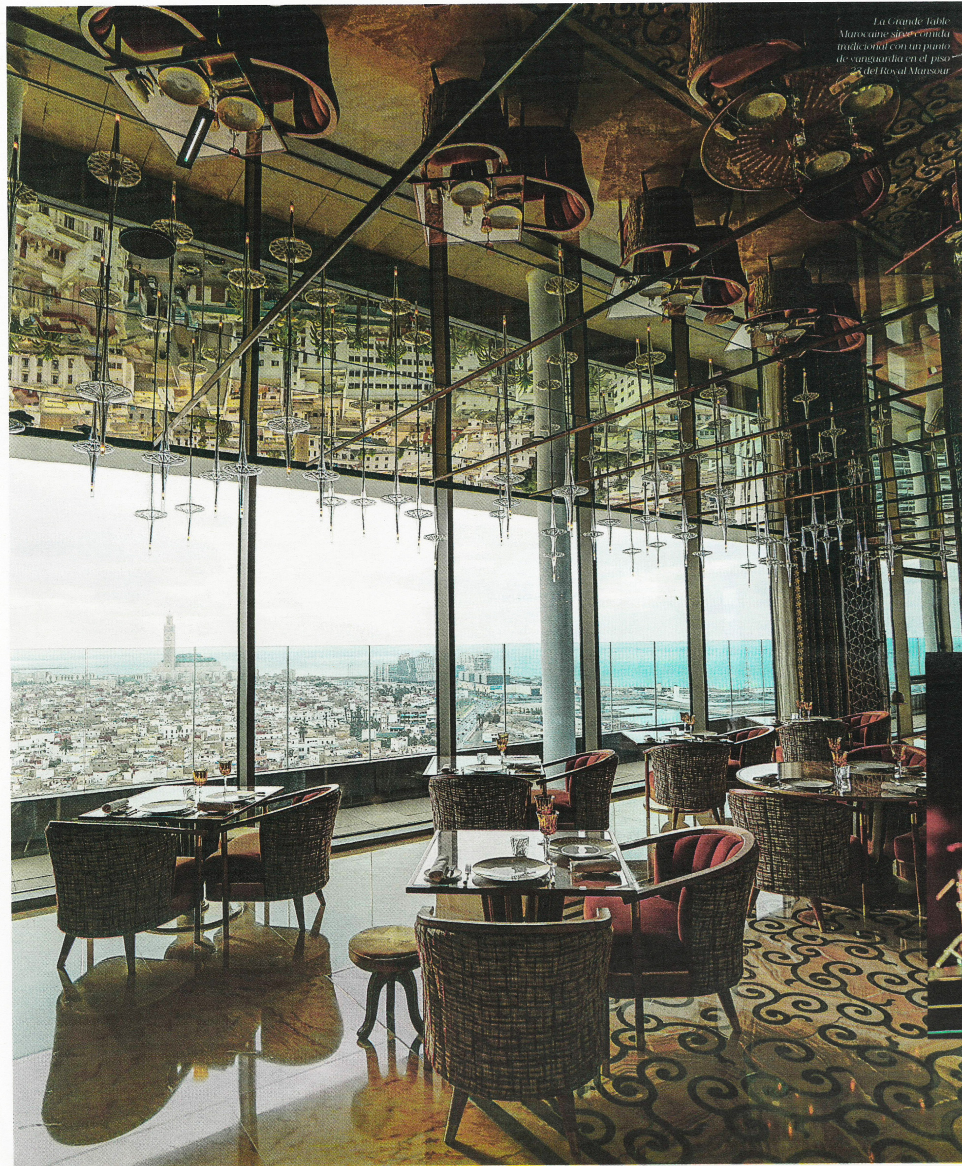
La Grande Table Marocaine sirve comida tradicional con un punto de vanguardia en el piso 23 del Royal Mansour