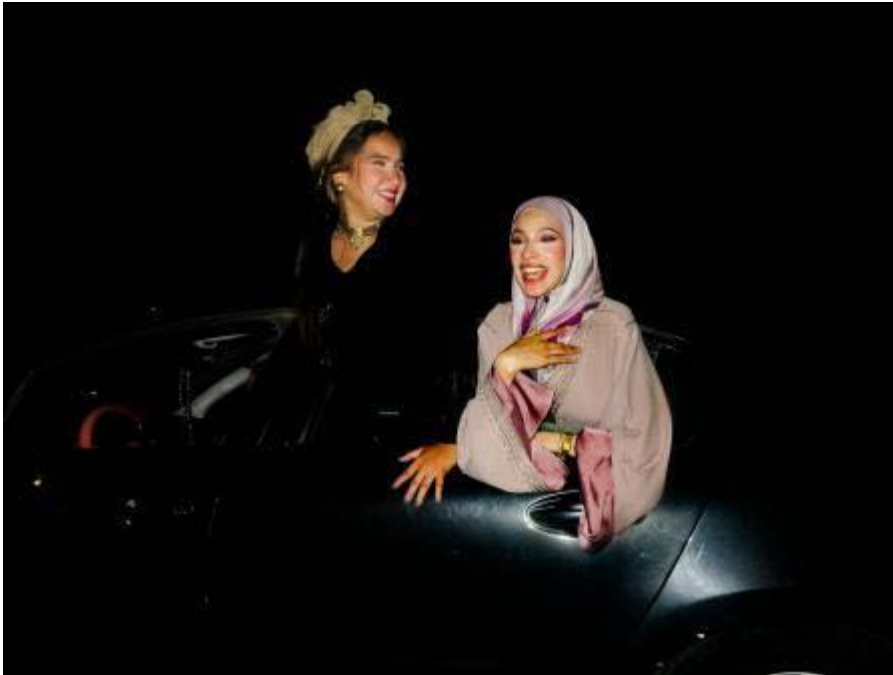
Unas jóvenes se divierten en la noche marroquí

sobre todo por las noches. Hay un gran número de bares y discotecas abiertos en la Corniche (un paseo marítimo quilométrico junto al Atlántico con edificios y hoteles de lujo). El tráfico a esas horas es todavía mayor que durante el día, de hecho hay atascos y es difícil circular.