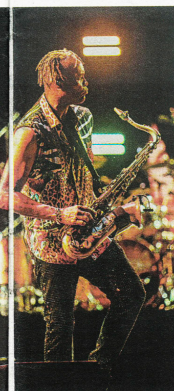
JAZZABLANCA El festival de música acoge actuaciones nacionales e internacionales durante diez días en julio