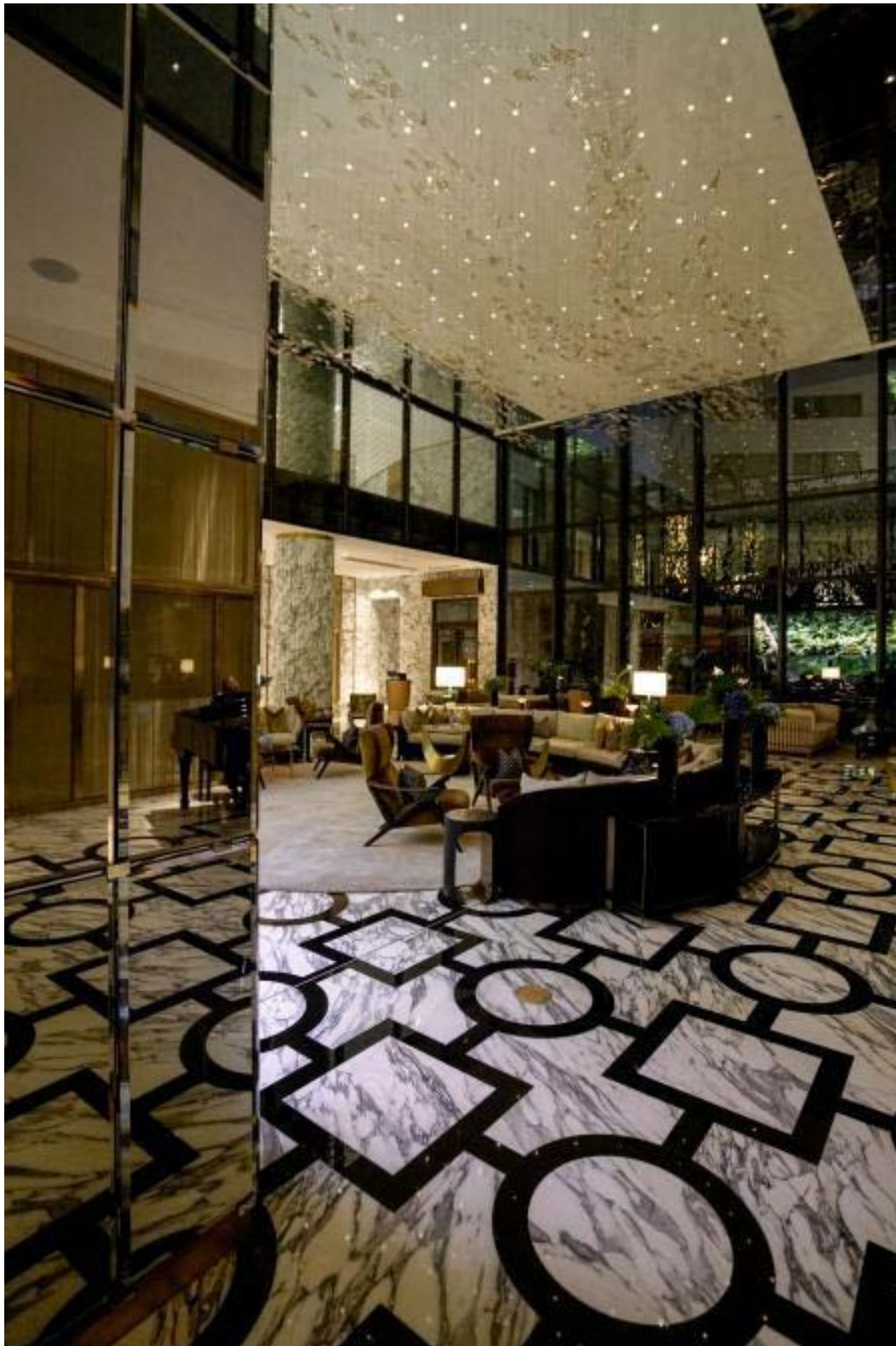
Hall del Royal Mansour Casablanca