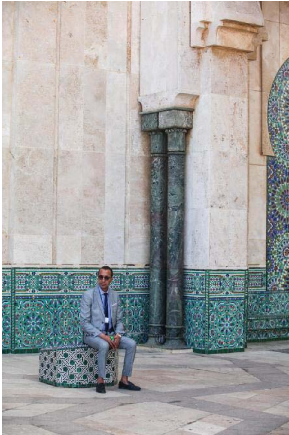
Mezquita de Hassan II